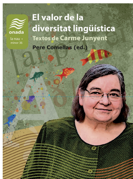
El valor de la diversitat lingüística Textos de Carme Junyent Pere Comellas (ed.)

Compromís del 30% + solidaritat del 60% + esperança del 10% = conscienciació del 100%